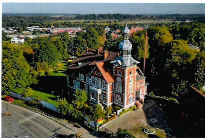
Водонапорная башня Инстербурга (1889 г.)