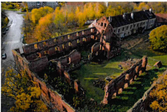
Замок Инстербург (XIV в.)