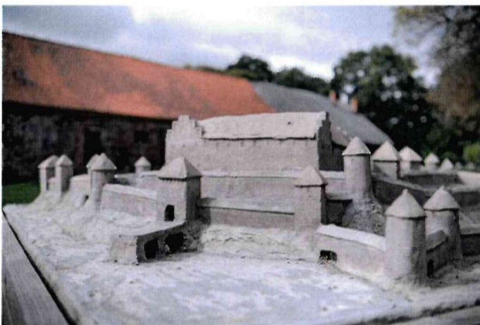
Замок Георгенбург (XIV в.)